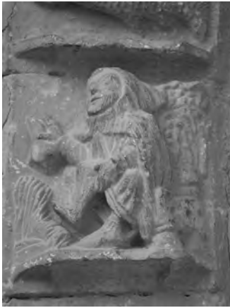
Figura 4: Detalle Febrero.

Para la figura de febrero observamos al tradicional personaje junto al fuego (Fig. 4). Para trazar su recorrido iconográfico debemos remontarnos a los ciclos mensuales de la antigüedad. En el tetrástico que acompaña el Enero del calendario de Filócalo 25 , se cita a Jano como dios titular del mes, se describen los actos dedicados a los lares donde se colocaba incienso ardiendo en los altares, y se señala que es en el comienzo del año cuando se realizan los actos oficiales en los que los cónsules son presentados con una copia de los fastos forrada en púrpura. En la ilustración que acompaña al texto aparece un hombre realizando el ritual dedicado a los lares en los que se quemaba incienso en su honor. Éste calendario cuando llegó al imperio carolingio debió copiarse su tipo iconográfico desligado del contenido original, dando lugar al manuscrito Ms. 387 de Viena en el que vemos a un personaje agachado calentándose al fuego. Este último se consolida así como el referente de todos los "ancianos al fuego" posteriores que evolucionaran adoptando todo tipo de actitudes.