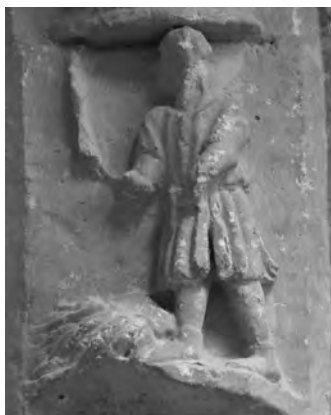
Figura 8: Detalle agosto.

Tras unas dovelas, cuya interpretación abordaremos posteriormente, continúa el repertorio con el mes de Agosto (Fig. 8). Para su representación se recurre a la escena del campesino golpeando con el mayal la mies tendida en la era. En la península esta iconografía arranca en el agosto del Panteón Real de San Isidoro y será el modelo que triunfe con muy pocas variaciones. En Francia se extiende esta misma representación y de nuevo sus únicas diferencias se observan al añadir elementos anecdóticos a la escena. Podrían enumerarse gran cantidad de precedentes para la composición de Treviño 43 , pero es en Amiens donde encontramos mayores similitudes ya que ambos, además de situarse en