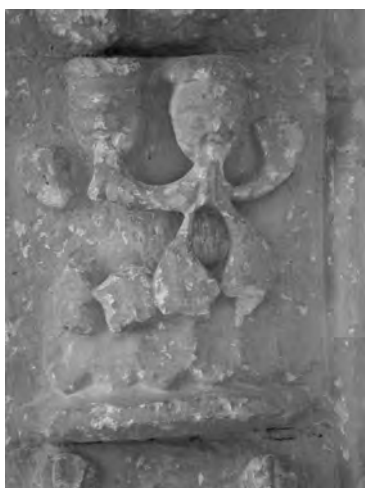
Figura 16: Detalle geminis.

mensuales. En el análisis realizado para las figuras anteriores hemos podido ver una relación más o menos directa con los ciclos italianos. Es en este país donde se gestó una iconografía local para alguno de los meses (pesca-febrero o marzo-espínario), cuya repercusión prácticamente pasó desapercibida en el resto de Europa, pero que sin duda debió circular junto con el resto de imágenes.