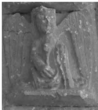
Figura 19: Detalle ángel.

coherente relacionarla con los gemelos zodiacales, creemos que tal afirmación debe hacerse con ciertas reservas.