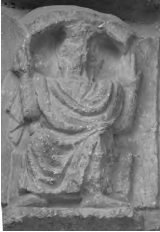
Figura 3: Detalle enero.

En la primera dovela nos encontramos la figura del dios bicéfalo Jano (Fig. 3), una de las numerosas imágenes de la antigüedad que ha pervivido en los tiempos del Medioevo. Para comprender su significado, debemos remontarnos a Numa Pompilius (s. VIII-VII a.C.), quien solucionó los desfases temporales del antiguo calendario griego incluyendo los meses de enero y febrero. Al mes de enero lo llamó Ianus en honor al primer rey de Lacio, representante de la paz y de todos los inicios 18 . El etrusco Tarquinio Priscio, aproximadamente en el año 153 a.c., realizó un nuevo intento de perfeccionamiento del calendario adaptándolo esta vez a los ciclos solares para evitar así los desajustes estacionales sufridos hasta el momento. La solución fue establecer un decimotercer mes conocido como Marcedoinus