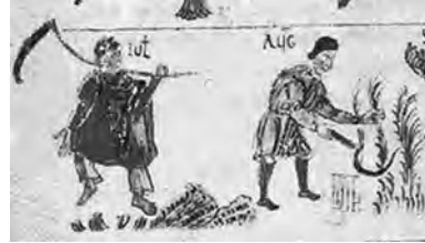
Figura 2: Detalle julio y agosto, ms 387, folio 90r., Abadía de San Pedro, Salzburgo.

En cuanto a las representaciones de la antigüedad, en su mayoría son de tipo alegórico o personificaciones (Calendario de Filócalo 15 ), pero también se observan unas incipientes manifestaciones activas, casi siempre en clara vinculación con temas agrícolas (mosaico de Cartago, Sarcófago Juno Basso (laterales), puerta de Marte de Reims). Estas poco a poco irán imponiéndose en siglos posteriores hasta terminar por afincarse como el tipo iconográfico definitivo en la Edad Media. El punto de inflexión lo marcará la aparición de las carmina Salzbürgiana (siglo IX) y los manuscritos de la escuela de iluminación de Salzburgo, obras literarias y gráficas que asentarán el giro decisivo hacia las escenas activas (Fig. 2) en las que aparecen desarrolladas las actividades propias de cada mes 16 . Así pues, para el estudio del calendario treviñés repararemos en las obras artísticas posteriores al siglo IX.