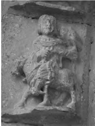
Figura 7: Detalle mayo.

El mayo de Treviño se ilustra con el característico halconero a caballo 37 (Fig 7), tema asociado a la nobleza en relación directa con el rey de primavera. La cetrería y la caza en general fueron las actividades preferidas de las clases altas. Mediante ellas se ejercitaban físicamente para la guerra y además mostraban de manera fehaciente su diferencia con respecto a los trabajadores de la tierra. En ocasiones, cuando el caballero porta un ramo de flores, representa el paseo primaveral del caballero, muy en relación con el amor cortés que comenzó a extenderse a lo largo del S. XII desde la Provenza hasta el resto de Europa 38 .