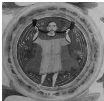
Figura 14: P.M.L., Ms. M.511, fol. 2r, detalle marzo (Hourihane) .

Es el caso de la dovela que sigue a la del signo zodiacal de Leo. En ella se muestra una figura de gran tamaño (Fig. 13) dispuesta de forma frontal con los brazos levantados a la altura de la cabeza. Ruiz Maldonado se muestra cauta en sus observaciones y comenta que la mano derecha del personaje podría estar sujetando un objeto, hoy destruido, relacionado con alguna de las faenas propias del mes de junio o julio 48 . Frontón Simón señala que pudiera tratarse del profeta Daniel, asociado al león (Leo) y en relación a ello plantea una sugerente teoría vinculando esta imagen a los zodíacos moralizados del XIV. Es conocida la polémica antiastrológica, nacida a partir del XI y XII, y su posterior resurgimiento entre los siglos XII y XIV, como resultado de la traducción de obras astrológicas en Toledo 49 . Por tanto, si considerásemos esta imagen como la de Daniel y las tres dovelas más pequeñas como una Anunciación, podríamos entresacar soluciones a este rompecabezas de tipo teológico atendiendo a los numerosos autores cristianos que buscaron otorgar un significado moralizado al zodíaco. Pero incurriríamos en un grave error si sólo observáramos en ellas su iconografía dejando de lado los aspectos estilísticos. Es tentador apuntar que las dovelas "sin identificar" fueron incluidas con una finalidad "cristianizadora" para que el conjunto de la portada no resultara demasiado profana, pero salta a la vista una diferencia de estilo más que notoria entre