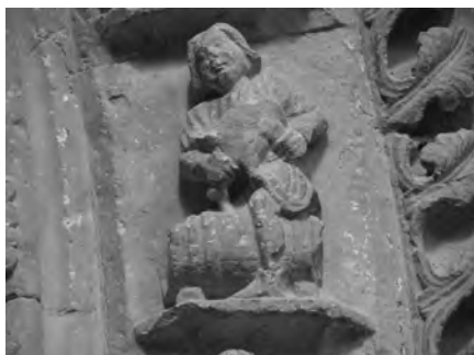
Figura 10: Detalle Octubre.

En estrecha relación con la escena anterior, aparece representado el proceso de trasiego del vino del odre a la barrica de madera (Fig. 10). Ofrece la peculiaridad de mostrar al personaje subido a horcajadas sobre la cuba, característica que entra en la península por la influencia de las obras góticas de la Isla de Francia. Este modelo aparece en Saint-Dennis tanto en el ciclo monumental de la puerta sur de la fachada occidental (1130), como en el menologio musivario que se despliega en el pavimento de la capilla de Saint-