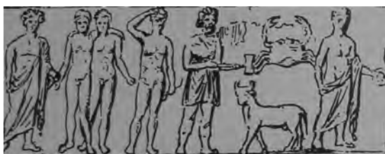
Figura 1: Detalle friso géminis y cáncer. Hagios Eleutherios. Atenas. (Webster).

La iconografía de los meses es un tema de larga tradición, teniendo sus orígenes en la antigua cultura grecolatina. Son escasos los ejemplos de calendarios ilustrados que han llegado hasta nuestros días de esta época, pero menos aún los que combinan los signos zodiacales con los ciclos mensuales.