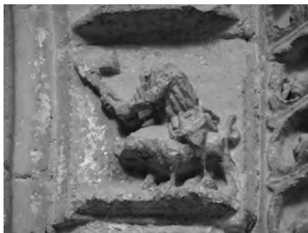
Figura 11: Detalle Noviembre.

Para la representación de noviembre se recurre al tema doméstico de la matanza del cerdo (Fig. 11). Existen muchas variantes de este tema, desde la apertura en canal del animal hasta el momento justo de asestarle el golpe mortal. En Treviño se sigue este motivo y de nuevo se incorporan las novedades góticas pues el personaje aparece subido a horcajadas sobre el porcino. Como nos explica Castiñeiras, esta escena aparece en los ciclos hispanos en noviembre ya que existía en el mundo