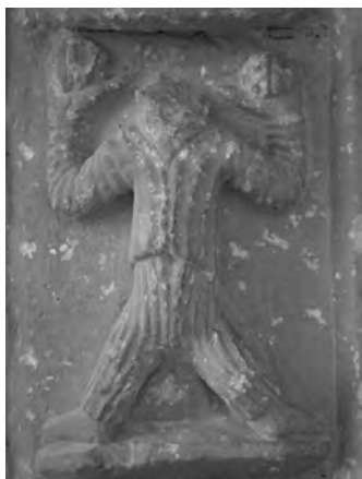
Figura 13: Detalle "cornero" .