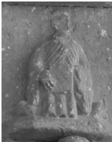
Figura 20: Detalle "profeta".

amoribus del filósofo griego Eustacio de Macrembolite (s. XII) quien nos dice que el mes de agosto se representa con un joven campesino cansado y sediento por la dura jornada de trabajo 57 .