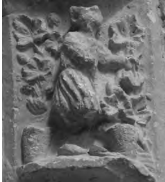
Figura 9: Detalle Septiembre.

El mes de septiembre se representa con la vendimia de la uva (Fig. 9). Paladio nos dice que “durante este mes, en los lugares templados y marítimos debe realizarse la vendimia” (X, 12). Prácticamente todos los menologios recogen esta escena ya que junto con la siega era uno de los pilares de las labores agrícolas 44 . Los buenos cuidados realizados en los meses anteriores (poda de marzo) ahora debían dar sus frutos para asegurar así un invierno bien suministrado. La dovela treviñesa sigue el modelo establecido para septiembre en el Panteón Real, pero incorpora un mayor desarrollo de los pámpanos en línea con el naturalismo gótico. Al igual que el ejemplar de Beleña de Sorbe, con una mano agarra la vid