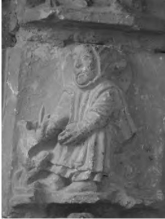
Figura 5: Detalle Marzo.

Tal y como nos dice Paladio (s V d.C.), el tratadista de agricultura más difundido en época medieval 30 , “en este mes, en sitios fríos se realizará la poda de las cepas” (Tratado de Agricultura, IV,I). Sin embargo también señala que en mayo deben hacerse varias labores relacionadas con las vides como la colocación de rodrigones, examinar los nuevos sarmientos, despampanar para que penetre mejor el sol o el acollamiento de las cepas (TA, VI, I-IV), por lo que bien pudieron confundir los canteros el orden de las dovelas atendiendo más a su propia vida rural que a la tradición iconográfica.