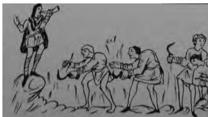
Figura 15: Ms. Cott. Tib. B. V, Detalle junio (Webster).

mensuales. En el análisis realizado para las figuras anteriores hemos podido ver una relación más o menos directa con los ciclos italianos. Es en este país donde se gestó una iconografía local para alguno de los meses (pesca-febrero o marzo-espínario), cuya repercusión prácticamente pasó desapercibida en el resto de Europa, pero que sin duda debió circular junto con el resto de imágenes.