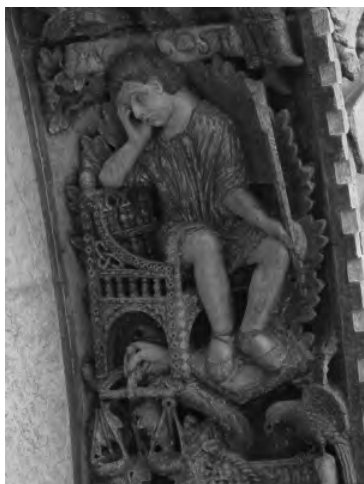
Figura 18: San Marcos de Venecia, detalle agosto.

coherente relacionarla con los gemelos zodiacales, creemos que tal afirmación debe hacerse con ciertas reservas.