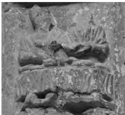
Figura 12: Detalle Diciembre.

En esta última dovela, dos comensales se disponen a celebrar con un gran festín el final de los trabajos del campo (Fig. 12). Una vez realizada la siega, vendimiada la vid y matado el cerdo, un buen banquete culmina todo un año de duros trabajos. Lamentablemente, al igual que ocurre con algunas dovelas anteriores, el paso del tiempo ha hecho que nos hayan llegado deterioradas y nos impide precisar qué portarían en las manos ambos personajes, quizá estén compartiendo un cuenco con el vino obtenido apenas dos meses antes.