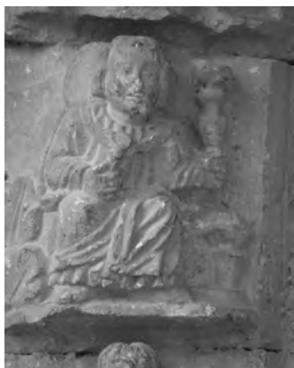
Figura 6: Detalle abril.

Para este mes, la correspondiente arquivolta nos muestra un joven imberbe entronizado y vestido con ricas ropas (Fig. 6). En su mano izquierda porta un ramo de flores y en la derecha una especie de cetro. A su lado se esculpe lo que parece un jarrón con flores. Se nos muestra joven, pues abril es el mes en el que renace la vida tras el invierno. Esta figura se asocia al rey de primavera cuyos modelos más cercanos parecen atender a influencias italianas y francesas. En el claustro de Tarragona vemos un personaje entronizado recibiendo un objeto de otro genuflexo mientras sostiene en su mano derecha un ramo de flores 33 . Pero los paralelismos italianos más próximos al tipo iconográfico, derivan del mayo de San Marcos de Venecia donde una figura entronizada está siendo coronada por dos doncellas.