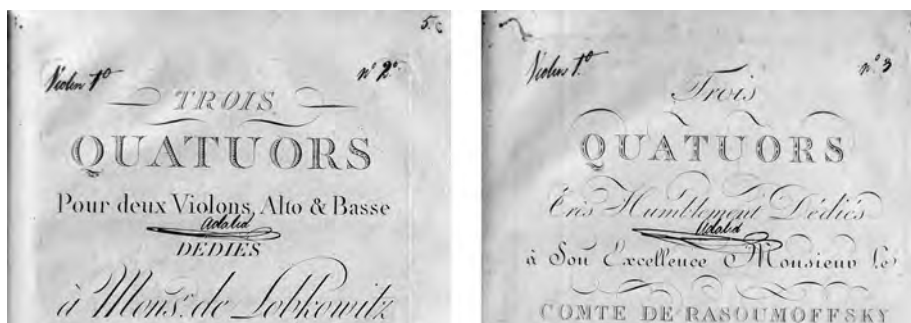
Imagen 2. Juego 4, cuartetos y quintetos, signaturas 013 a 017. Parte superior de las portadas localizadas en la parte del violín primero, signatura 013.

tos de los opus 2, 18, y 59 y los quintetos de los opus 4 y 5 se corresponden con los números 1º, 2º, 3º, 5º y 6º respectivamente 38 . La numeración no coincide con la recogida en la etiqueta de la tapa del volumen de la parte del violín, por lo que las obras pueden o haber sido tocadas antes de encuadernarse, siguiendo la anterior numeración, o una vez encuadernadas pudieron haber sido seleccionadas y numeradas de acuerdo con algún fin práctico (véase Imagen 2). Un caso parecido de este tipo de seriación vuelve a darse en los quintetos para violonchelo de Bernard Romberg (1767-1841) y de J. Muntz Berger (1769-1844). En todas las portadas consta el escrito 5º de V[iollon]chelo –quintetos de violonchelo–. El quinteto de Romberg es el 1º y le siguen otros cuatro quintetos de Muntz Berger con la numeración del 2º al 5º. En esta ocasión la numeración coincide con la dispuesta en la etiqueta de la portada de la tapa del volumen de la parte del violonchelo 39 .