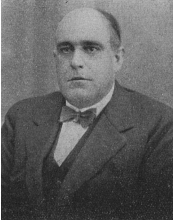
Figura 2. Carlos de Corral y Tomé. La Piel y sus Industrias , n° 320, septiembre (1934).