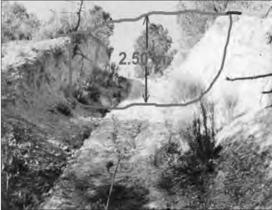
Figura 2. Sección de vaciado sobre el nivel original en un tramo de acceso al cauce para la construcción de un dique.