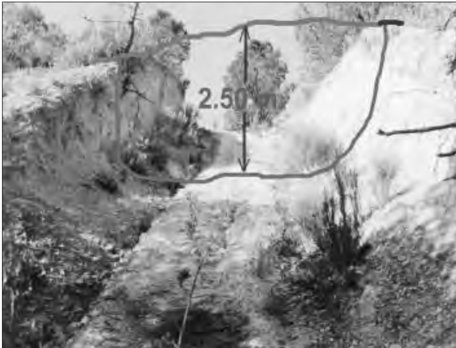
Figura 1. Camino de acceso al cauce desde un campo de cultivo para facilitar el paso de materiales y maquinaria necesarios para la construcción de un dique.

La visita a todos los diques de esta cuenca ha permitido observar que, en ningún caso, las zonas roturadas para la construcción de estos caminos, han sido de nuevo reforestadas, ni siquiera los tramos de acceso al fondo de los cauces, que en muchas ocasiones tienen pendientes superiores al 100% (Figura 1) y en algunos casos, encajamientos sobre la superficie original de más de 2 metros (Figura 2).