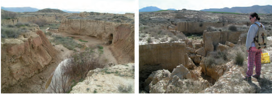
Figura 5. A) Vista general del barranco principal del área de estudio. En el margen derecho se puede observar un puente natural formado en el outlet de un gran pipe. B) Detalle de ese pipe con el puente natural colapsado. La imagen está tomada desde el margen del pipe y se observa al fondo el barranco.

impermeable y se propagan siguiendo este nivel hasta alcanzar el gully . El outlet aparece colgado sobre el fondo del gully por lo que su desarrollo está condicionado por el nivel de base (Fig.4 y 5).