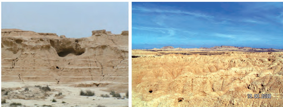
Figura 7. A) Pipe de escala centimétrica desarrollado sobre el nivel laminado superior. B) Pipes de dimensiones decimétricas sobre el nivel laminado inferior.

recen desarrollados en las zonas donde el nivel laminado superior presenta una mayor potencia y los niveles masivos intercalados tienen mayor desarrollo como es la zona del Piskerra (Fig. 7) o junto a las instalaciones militares donde el nivel laminado inferior presenta su mayor potencia.