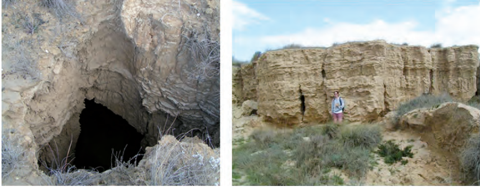
Figura 4. A) Vista somital de un pipe generado por procesos de seepage en el margen de un gully. En la imagen se puede observar como el fondo del pipe coincide con el techo del nivel infrayacente. B) Vista lateral de estos pipes con conductos verticalizados.