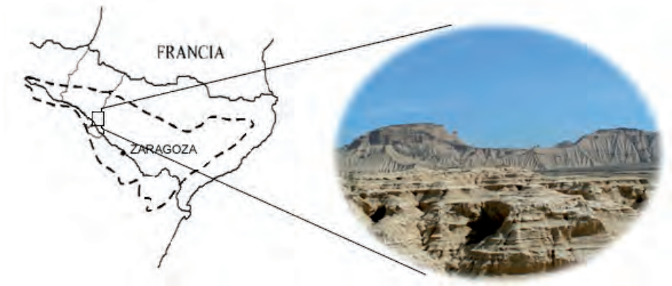
Figura 1. Localización del área de estudio.

Las Bardenas Reales, sector centro-occidental de la Depresión del Ebro, constituyen una depresión erosiva de 415 km 2 de extensión, formada por sedimentos de edad Miocena y Cuaternaria (Fig.1). Los sedimentos terciarios, arcillas miocenas de la Formación Tudela, aparecen en los márgenes de la cuenca dando lugar a pendientes escarpadas con una alta densidad de reguercización. Los depósitos cuaternarios, arcillas y limos holocenos procedentes del lavado de las arcillas circundantes, han sufrido una intensa erosión y el desarrollo de profundos gullies sobre ellos. El clima es semiárido de carácter mediterráneo, con una temperatura media anual de 13°C y una precipitación media anual de 350 mm. Las lluvias son de carácter tormentoso con una gran variabilidad estacional e intensidad