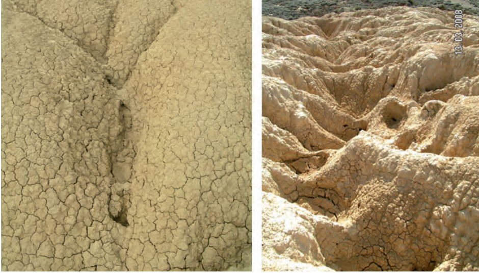
Figura 6. A) Pipe de escala decimétrica desarrollado sobre el nivel masivo intermedio. B) Pipes de dimensiones métricas en la zona de Cabecico Losado circunscritos a la red de regueros.

recen desarrollados en las zonas donde el nivel laminado superior presenta una mayor potencia y los niveles masivos intercalados tienen mayor desarrollo como es la zona del Piskerra (Fig. 7) o junto a las instalaciones militares donde el nivel laminado inferior presenta su mayor potencia.