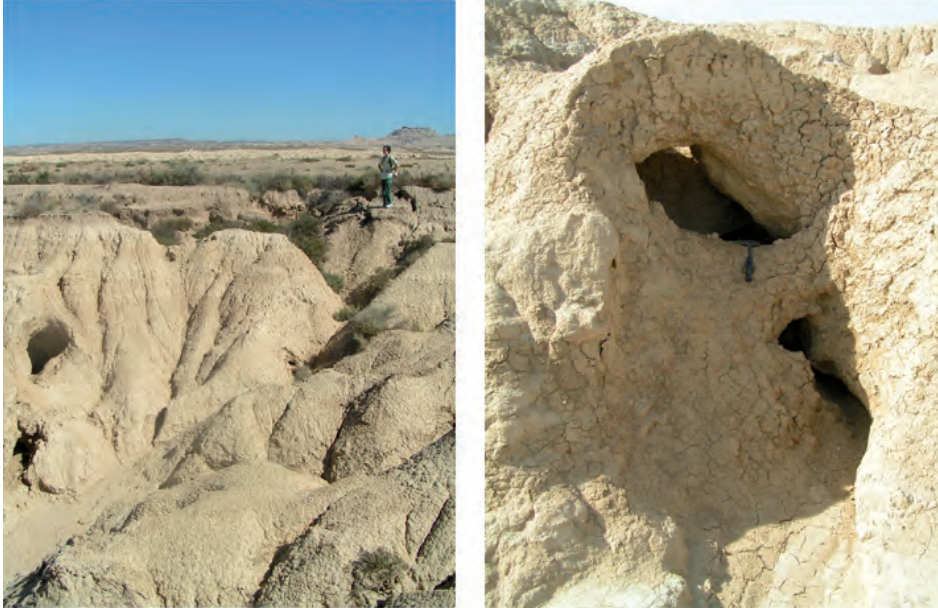
Figura 2. Dos aspectos en campo de los pipes desarrollados por procesos de seepage en las formaciones arcillosas de los rellenos de la cuenca.