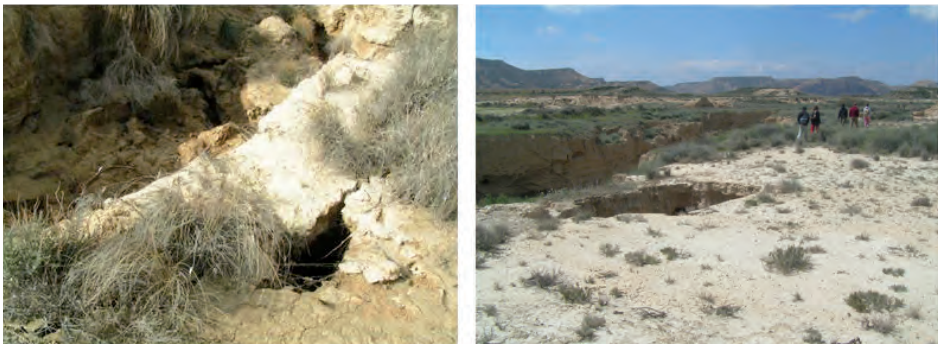
Figura 3. A) Detalle de la grieta extensional en el margen de un gully e inicio de un pequeño pipe incipiente y B) pipe de gran tamaño formado en el margen del barranco principal.