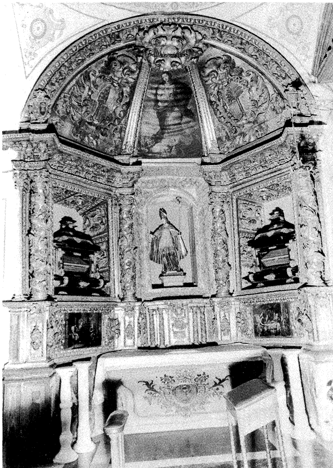
Lám. 1.- Retablo de la capilla de los Marín de Rodezno.