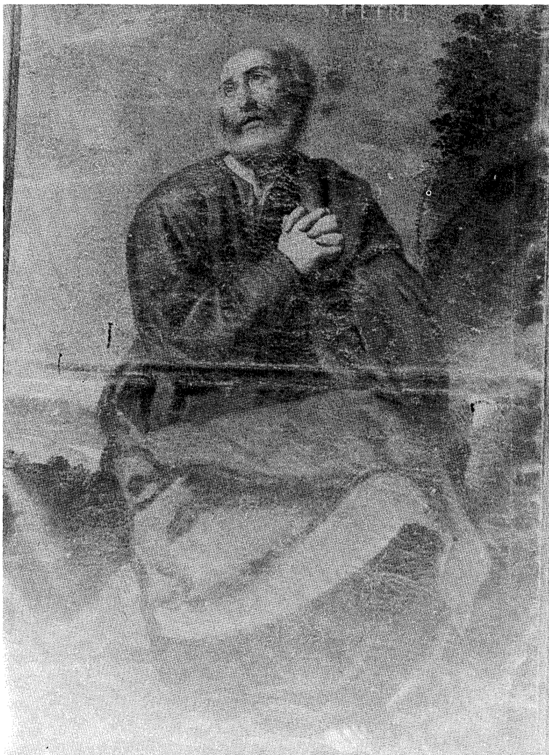
Lám. 2.- Lienzo de San Pedro.