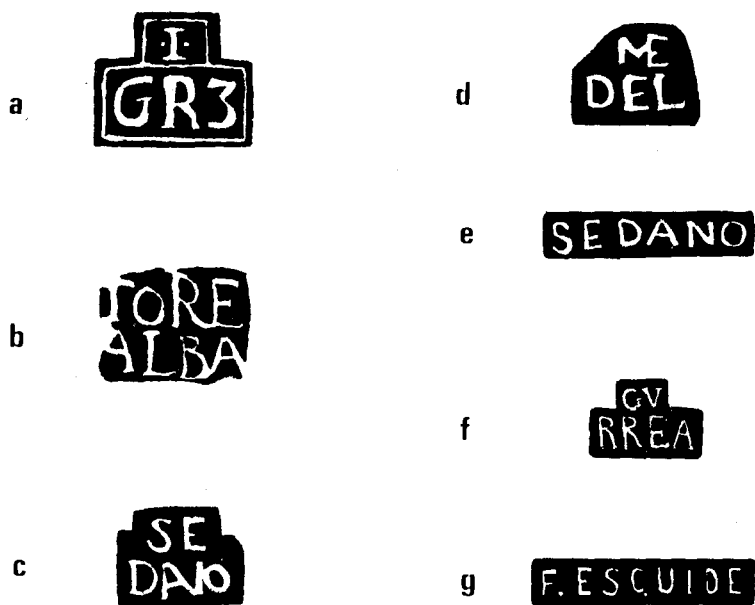
Fig. 2.- Punzones de plateros de Santo Domingo de la Calzada.