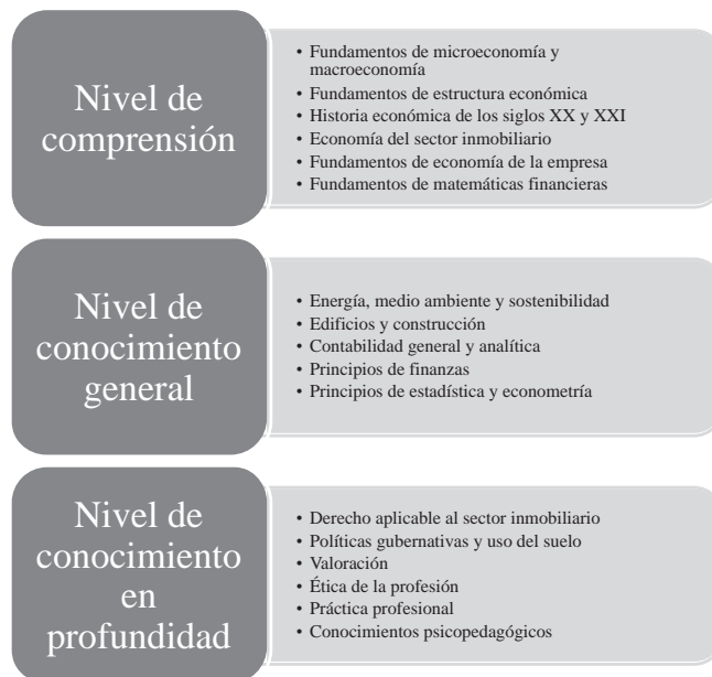
Figura 1. Plan de Formación

En base a los documentos antes citados, y a nuestra propia experiencia profesional, las materias que se deberían incluir en cada nivel serían las que se pueden encontrar en la figura 1.