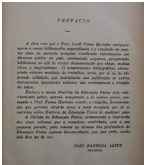
Figura 2. Prefácio História da Educação Física e dos Desportos no Brasil

En la Figura 3 –Dedicatória História da Educação Física e dos Desportos no Brasil – se puede observar que Inezil Penna Marinho optó por hacer un homenaje y se la dedicó al Sr. Gustavo Capanema 26 , exministro de Educación y Salud.