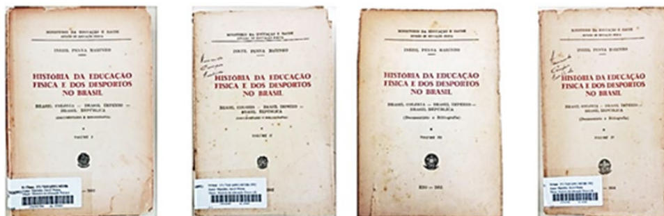
Figura 1. História da Educação Física e dos Desportos no Brasil Portadas de los volúmenes I, II, III e IV

El libro está organizado teniendo los marcos históricos de la política brasileña como delimitadores de los volúmenes y de sus partes. La división escogida: la Independencia de Brasil; la Proclamación de la República; la Revolución de 1930; el Golpe de Estado de 1937; el Golpe de 1945; la posesión del Presidente electo en 1946 15 .