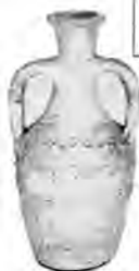
Figura 5. Hoja informativa para la pieza de arqueología Jarra visigoda