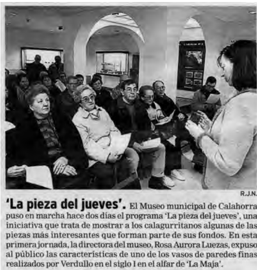
Figura 1. Presentación de la “Pieza del Jueves”, periódico La Rioja , 1 de marzo de 2003

En marzo del año 2003 se puso en marcha esta iniciativa con la finalidad de dar a conocer las diversas colecciones del Museo tanto de las que se encuentran expuestas al público en las salas de exposición permanente como aquellas que se albergan en los almacenes o salas de reserva y, por tanto, no expuestas al público (Figura 1). El ámbito de actuación del programa ha consistido en la difusión no solamente de los fondos del propio Museo Municipal sino también de las piezas en depósito de otras instituciones externas.