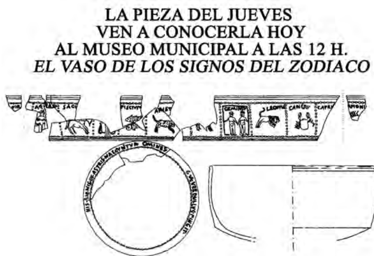
Figura 2. Ejemplo de octavilla

trecientas octavillas, difundiendo la actividad. En la octavilla figura como título La Pieza del Jueves , Denominación de la misma y dibujo o fotografía de la pieza en cuestión, lugar de realización y hora a la que se lleva a cabo la actividad, cuya asistencia a la misma es libre y gratuita. La finalidad de las mismas es atraer a ese público potencial, que en nuestro caso no es un público escolar, sino jóvenes, adultos bien sea de forma individual o en grupos organizados (amas de casa, tercera edad, asociaciones, turistas, etc.). Como señala M a del Carmen Valdés Sagués 12 : "la mayor parte del público no es especialista y necesita más ayuda para comprender el significado y los valores de los objetos que se exhiben. Los servicios más directamente relacionados con las piezas se ofrecen en las propias salas y presentan la ventaja de la presencia constante de las obras y su relación con ellas" .