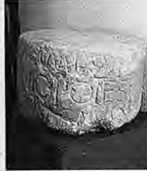
Fragmento de miliario/ M.A.

Este 'miliario' hace referencia a la Legión VI romana, acan-