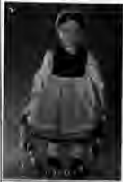
Figura 3. Hoja informativa para la pieza etnográfica Muñeca ataviada con traje regional de Calahorra