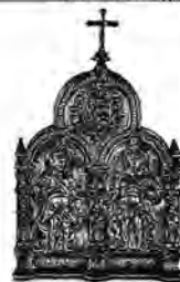
Figura 6. Hoja informativa para la pieza de bellas artes Portapaz