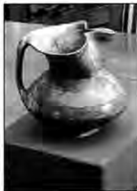
Figura 10. La Glorieta , periódico informativo del Ayuntamiento de Calahorra, mayo 2004

Todos los jueves de mayo, a las 12 horas, la directora del Museo, explicará la riqueza artística de esta pieza.