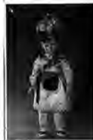
Figura 4. Hoja informativa para la pieza etnográfica Muñeco ataviado con traje regional de Calahorra