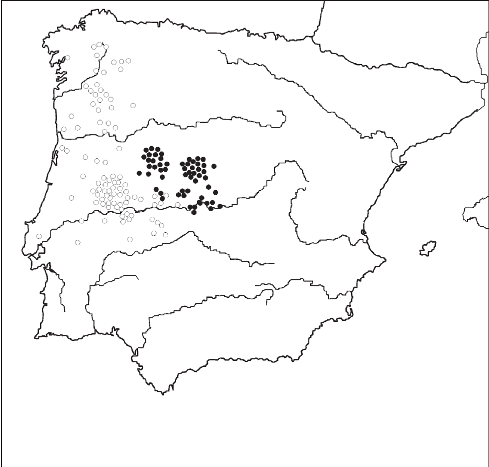
Figura 2: testimonios epigráficos de dioses lusitanos (círculos blancos) y lápidas con gentilicio del difunto en las áreas lusitana o vettona (círculos negros)

ta, junto al nombre del difunto, la pertenencia de éste a un grupo social reseñado en genitivo de plural. Estos testimonios, que se extienden por ambas mesetas y por el área cántabro-astur desaparecen, en general, en las regiones occidentales de la península. En el territorio vettón, estos hallazgos son muy numerosos y dejan de estar representados a partir de una línea que coincide, en buena medida, con los límites establecidos hasta el momento. Estos datos, junto a los de los teónimos lusitanos cita-