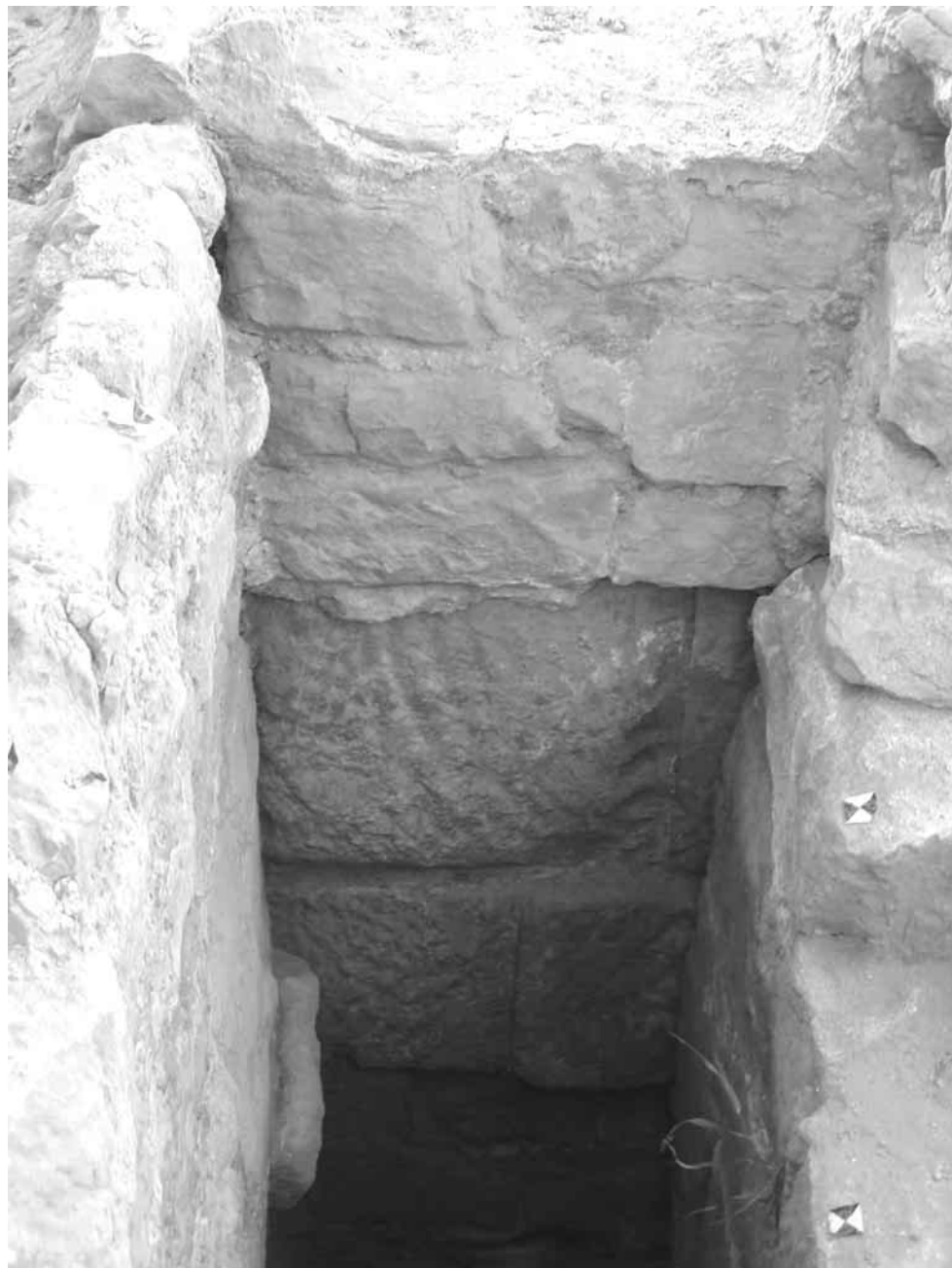
Figura 3. Detalle de uno de los cajones