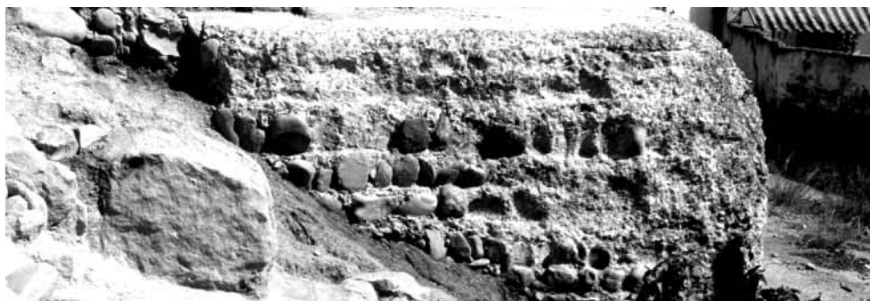
Figura 2. Bloque de opus caementicium

Más arriba, existe otro tramo que presenta una cara alisada, en la que pueden distinguirse al menos cuatro bancadas de opus caementicium . Esta fisonomía parece reflejar una posible elaboración mediante la técnica de encofrado, según la cual se establece un entablamento a modo de cajón donde luego se vierten las capas de mortero que se macean solidamente 5 .