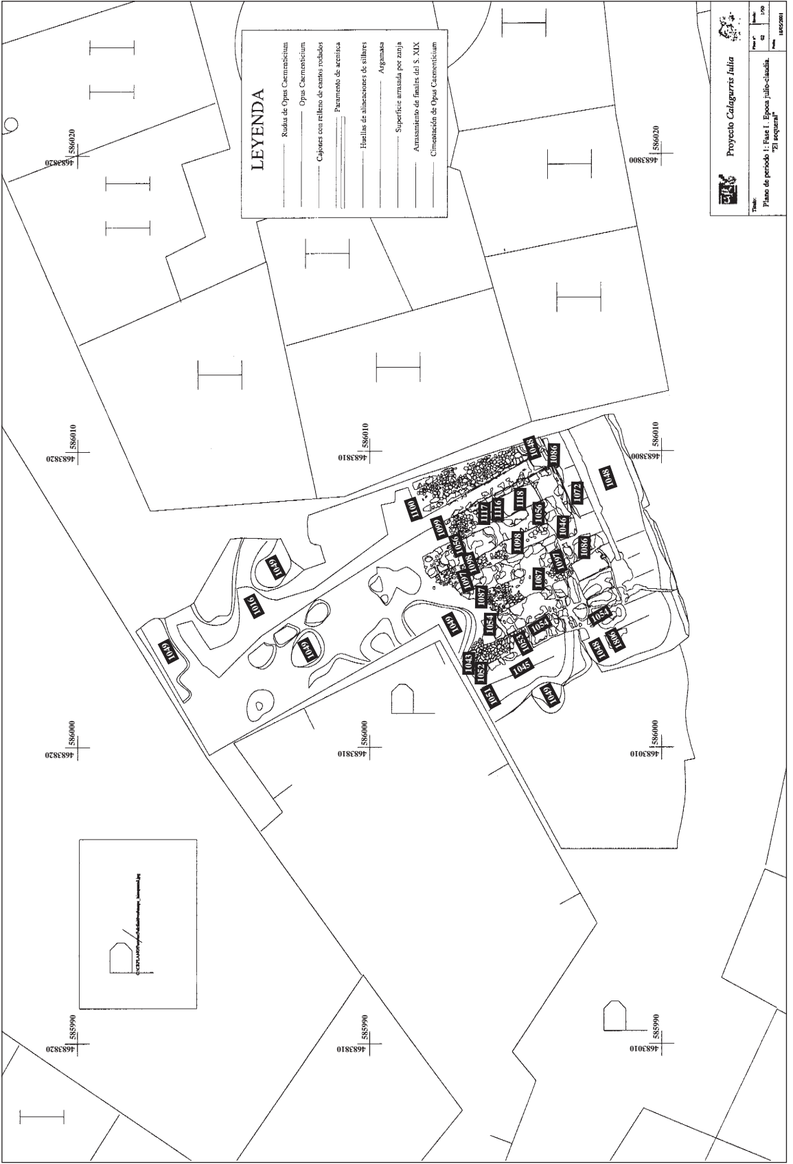
Figura 4. Planta de la cimentación del torreón de El Secueral. Cartografía: Ane Lopetegui