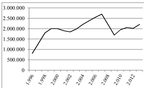
Gráfico 1. Evolución anual de CPD (1996-2013)

En primer lugar, a la necesidad de flexibilidad de las empresas para adaptarse a la temporalidad 3 y a la estacionalidad 4 del mercado de trabajo español, donde los ciclos de dicha estacionalidad se pueden observar en el Gráfico 2, sobre la evolución mensual del número de CPD en el periodo 1996-2013